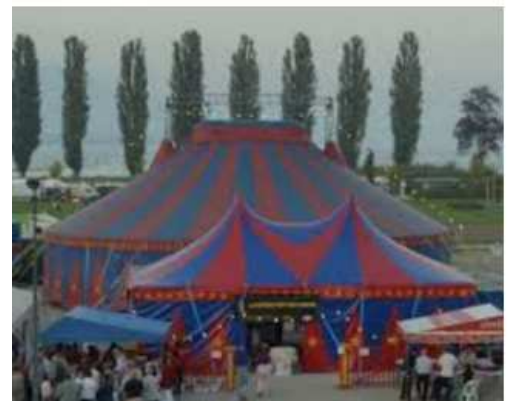
Le chapiteau du cirque Helvetia

17h : « À la fin du show, quand on change de ville, on démonte le chapiteau et on range tout : les rideaux, les chaises, la toile... Tout le monde aide à ranger : avec neuf personnes, tout est rangé en deux heures. Mais il faut quatre à cinq heures pour tout monter encore une fois. »